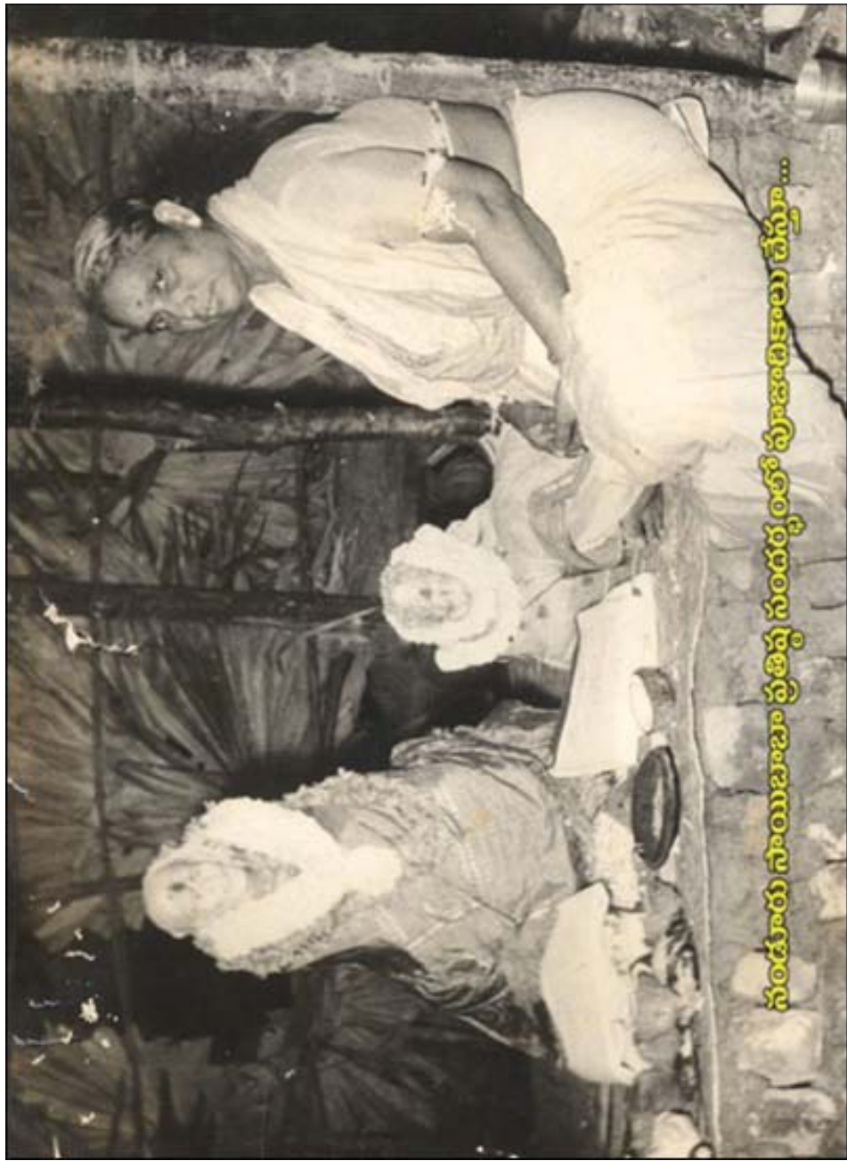
సంకూరు సాయిబాబా ప్రతిష్ఠ సందర్భంలో పూజారికాలు చేస్తూ...